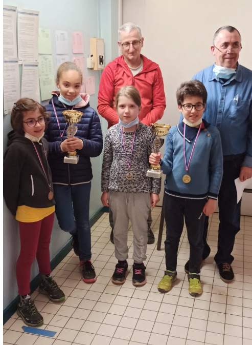
Nos jeunes joueurs en herbe après la remise de trophées

Le Championnat de Bretagne Jeunes s'est déroulé à Pontivy du 17 au 20 février 2022, où 8 joueurs représentaient le club Guingampais.