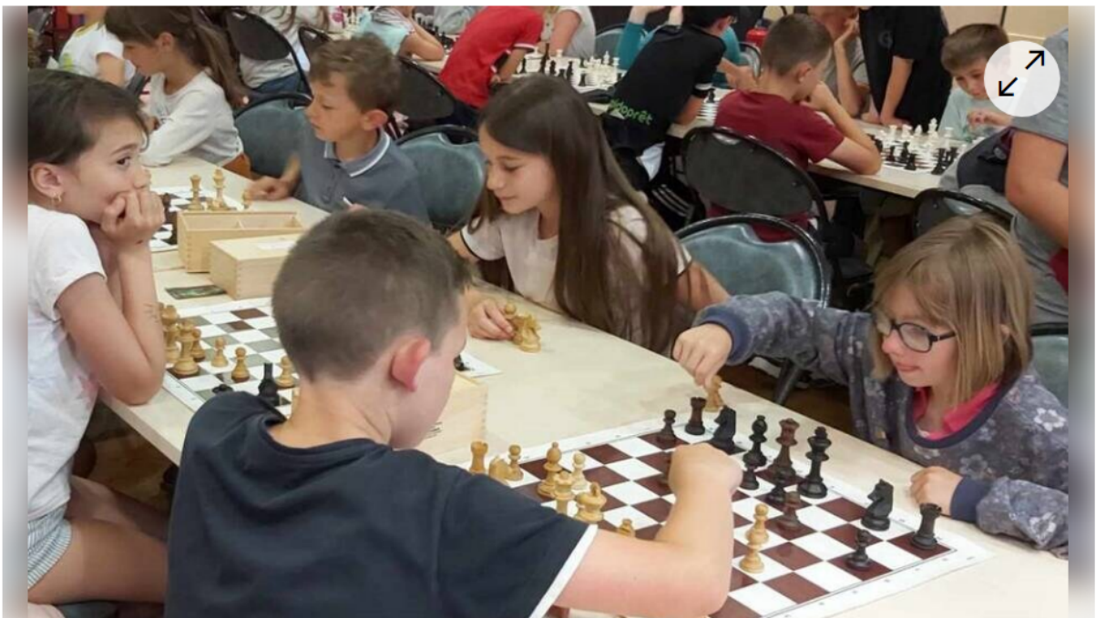
Les élèves ont participé à une rencontre d'échecs avec des enfants d'autres écoles, ainsi que des jeunes licenciés du club de l'Échiquier guingampais.

Le 9 juin 2022, un rassemblement scolaire a regroupé environ 200 élèves des écoles de Ploumagoar, Grâces, Plélo et St Léonard. Ces derniers ont pu jouer autour d'un échiquier et d'activités associées tel le condi chess.