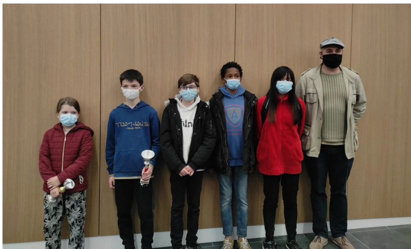
Photo prise à l'issue de la remise des prix du championnat de Bretagne à Pontivy.